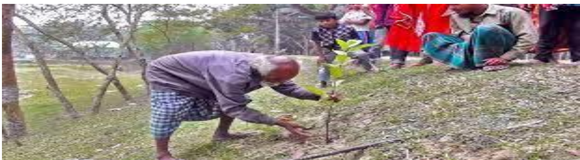
Le Vieillard plantant un arbre