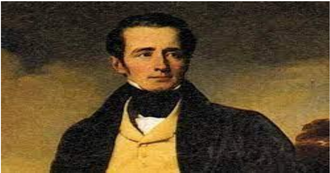
Alphonse de Lamartine

Alphonse de Lamartine, « Les méditations poétiques », 1820.