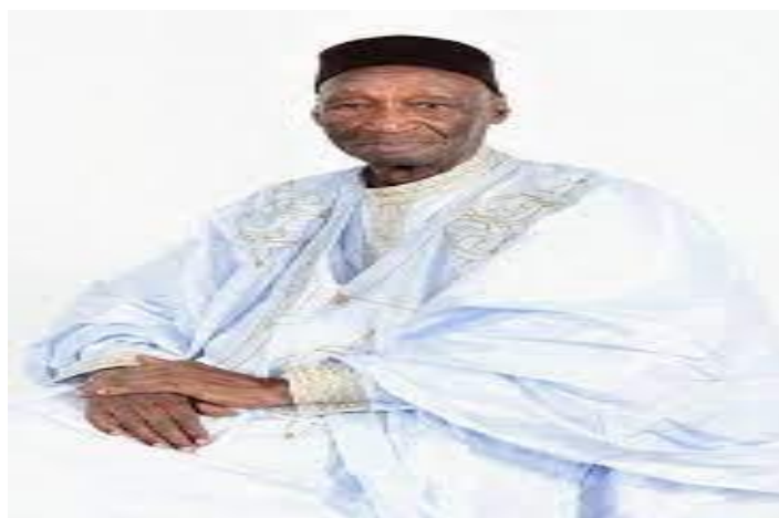
Djibril Tamsir Niane

Djibril Tamsir Niane, « Soudjata ou l'Épopée Manding », Présence Africaine, 1960.