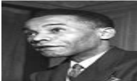
Léon Gontran Damas

Léon Gontran Damas, « Black Label », Gallimard, 1956.