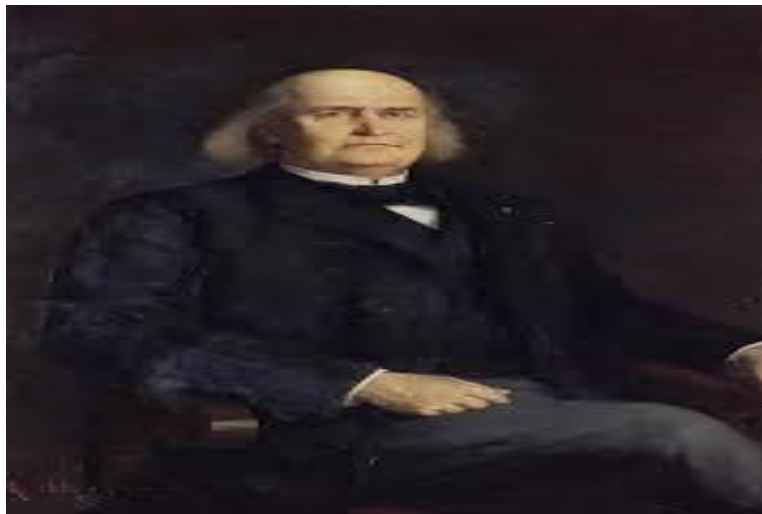
Leconte de Lisle

Charles Marie Leconte de Lisle, « Poèmes antiques », 1852.