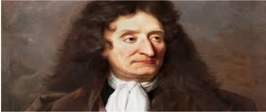
Jean de La Fontaine