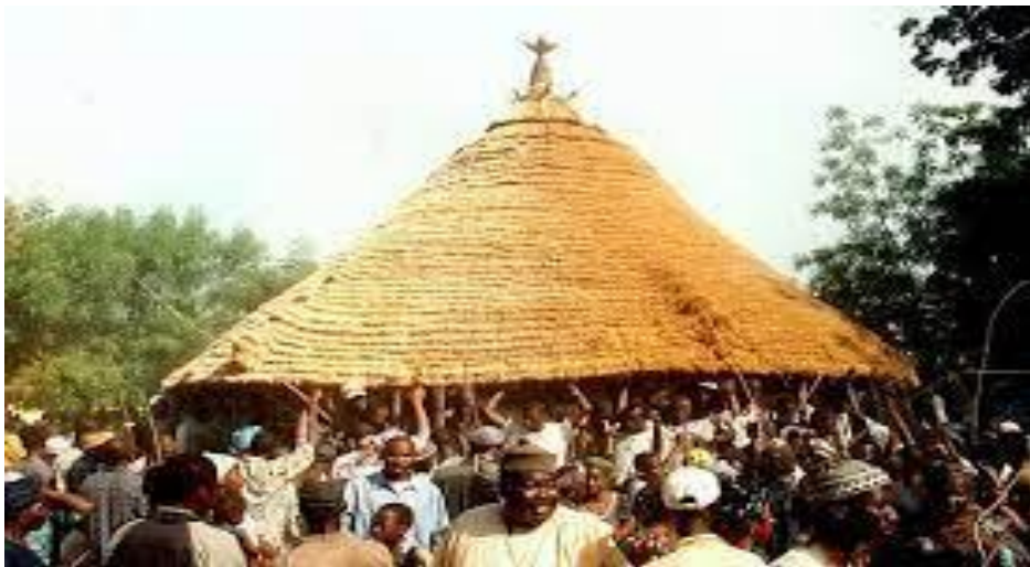
Village de Kangaba

Le jour où Sogolon accoucha est resté gravé dans la mémoire des griots. D'énormes nuages obscurcirent le ciel ; le tonnerre fit autant de bruit que cent tam-tams, les éclairs rayèrent le ciel et, alors qu'on était en pleine saison sèche, la pluie se mit à tomber, cependant qu'un vent violent faisait ployer les branches.